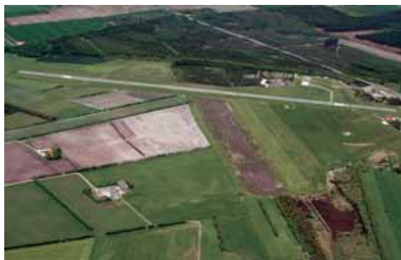
EKVH på en varm forårsdag. Bemærk svæveflyet i luften.

Flyveren blev parkeret og det var tid til en kop kaffe i klubhuset, hvor vi fik talt dagens træning igennem: